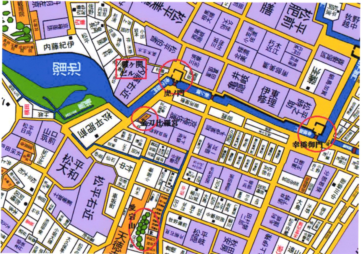
愛宕山は山の手線内では自然の山として最高峰。この西側にある天徳寺は、敷地こそ小さくなっているが現在も残っている

参照 http://onjweb.com/netbakumaz/edomap/edomap.html