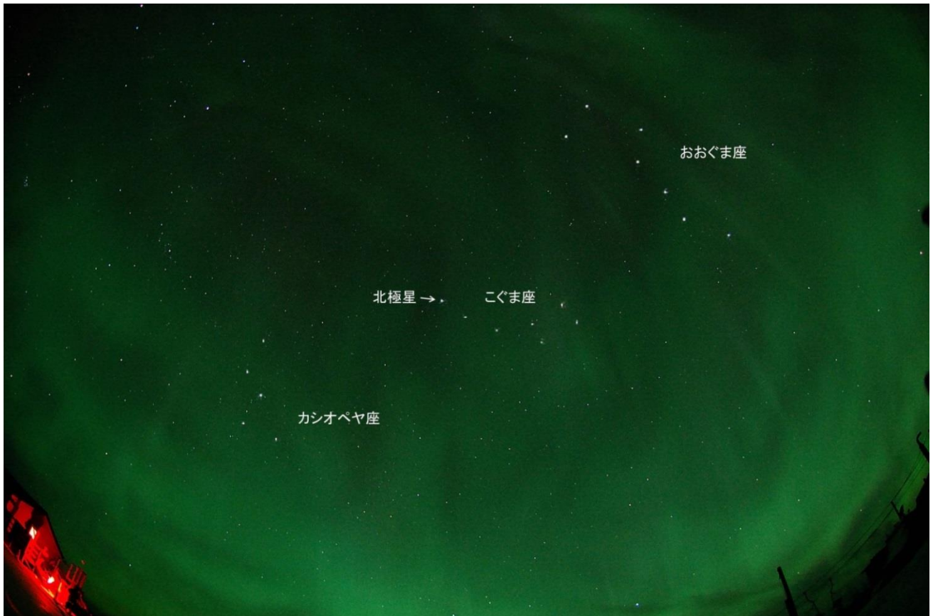
オーロラと北天の星座 撮影地：アラスカ・フェアバンクス郊外

こぐま座のしっぽの先が北極星です。昔から船を進める方向や位置を知るための目標とされてきました。一方、こぐまの肩の部分にある \beta 星と \gamma 星は、ヤライボシ（矢来星）と呼ばれ、北斗七星が北極星を攻めようとするので回りながら守っている、という言い伝えが残っています。