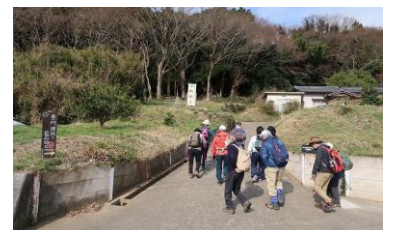
天の川沢コースから登る