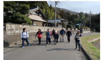
8時38分出発、足取り軽やか