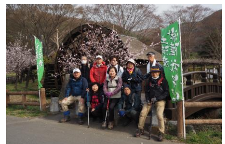
小町の館水車前にて