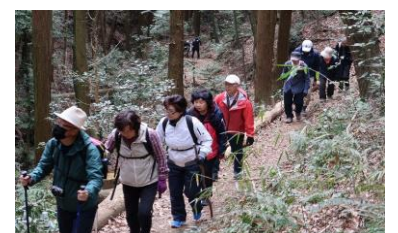
登山道は歩きやすい