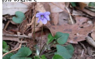
スミレが所々咲いていた