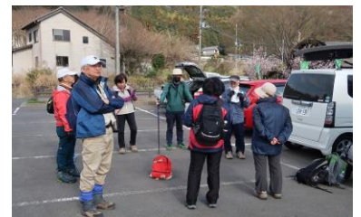
小町の館駐車場にて