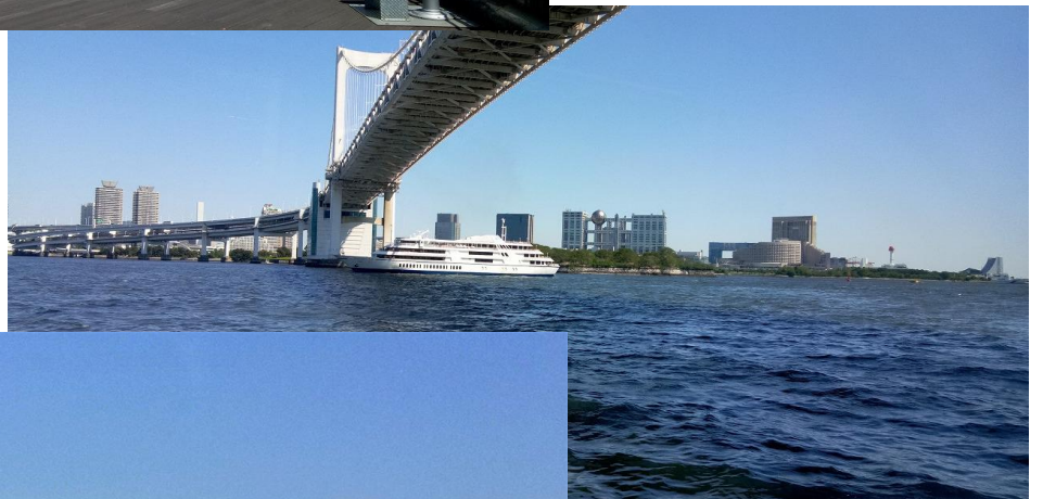
【右】レインボーブリッジをくぐる時、レストランシップとすれ違う。