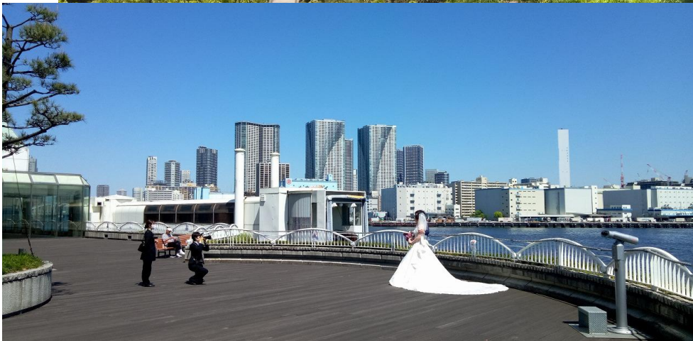
【左】竹芝ふ頭でレインボーブリッジを背景に結婚記念写真を撮る二人。ここは直前に我々が写真を撮った所。