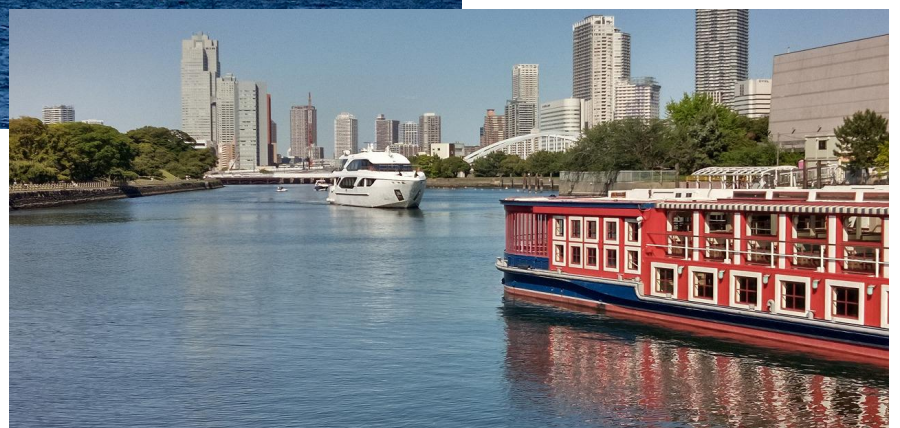
【右】私たちが下船して、仕事を終えた「東京みなと丸」が係留地に戻ってきたところ。 左側は浜離宮恩賜庭園。