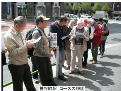
神谷町駅 コースの説明