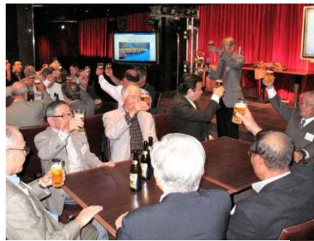
ビンゴゲームで幸運をゲット