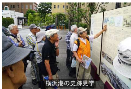
横浜港の史跡見学