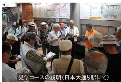
見学コースの説明(日本大通り駅にて)