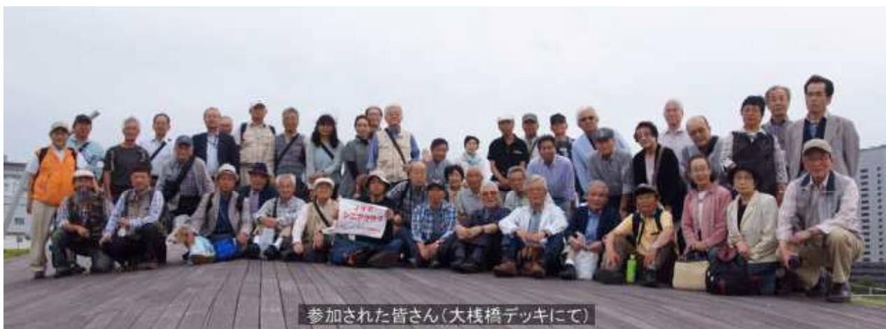
参加された皆さん(大桟橋デッキにて)