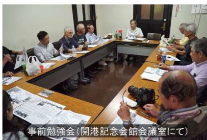
事前勉強会(開港記念会館会議室にて)