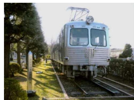
東急電鉄に納入したステンレス車両